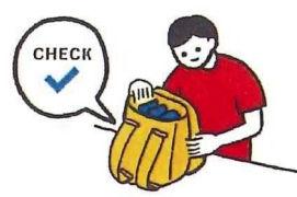
□ 非常用持ち出しバッグの中身を確認