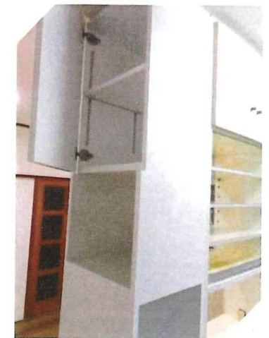
奥様のご要望を叶えた 作り付け家具の一部です。